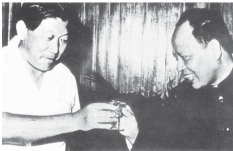
L'ambassadeur de Chine populaire au Cambodge, Sun Hao (à gauche) trinque avec Ieng Sary, beau-frère de Pol Pot et chef des affaires étrangères du « Kampuchéa démocratique ». Photo retrouvée par l'armée vietnamienne dans les archives abandonnées par les dirigeants khmers rouges en janvier 1979 à Phnom Penh lors de leur fuite.

culturelle. Un programme de l'université Yale, avec relais sur place au Cambodge, a permis de mettre à jour et d'inventorier des dizaines de milliers de pages d'archives servant de base aux travaux des chercheurs et au Tribunal spécial Khmers rouges installé à Phnom Penh avec l'appui des Nations unies pour juger les grands responsables encore en vie.